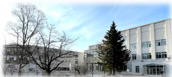
4月15日に撮影。最高気温26度でした。