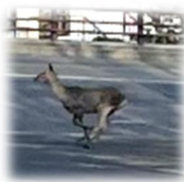
お馴染みの来客も…