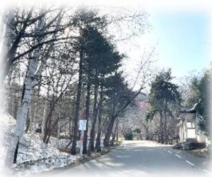
敷地にはまだ雪があります。