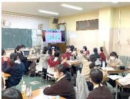
スマホ・ケータイ安全教室(4月27日)