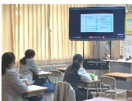
姉妹会総会・オンラインNY国連研修報告会(5月11日)